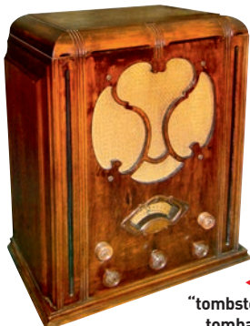
◀ Poste RCA “tombstone” (pierre tombale) de 1930.

Le 62 e bimestriel de l’association Radiofil est disponible. À découvrir notamment, comment construire une batterie compacte 4 V - 40/80 V ; le matériel de guerre terrestre en 1914 ; l’histoire de la modulation de fréquence ; comment réaliser un récepteur simple dans la bande des 20 m, ou encore un amplificateur à EL84 montés en triodes... Renseignements : Radiofil, 22 rue Paul Ronval, 59245 Recquignies. Tél. 09 62 09 19 36 (le matin). E-mail : abonnements@radiofil.com