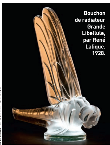
Bouchon de radiateur Grande Libellule, par René Lalique. 1928.